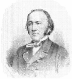
Claude Bernard http://fr.wikipedia.org/wiki/Claude_Bernard (1813-1878)

Personne, d'ailleurs, n'est capable d'expliquer pourquoi les épidémies de peste et de choléra du Moyen Âge, de suette picarde (qui a sévi de 1718 à 1906), et plus récemment, de scarlatine, se sont arrêtées sans vaccin, et sans décimer toute l'humanité...